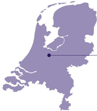
Kanaleneiland, wijk in Utrecht