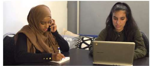
Omgaan met medische gegevens

Je kijkt mee met hoe je omgaat met medische gegevens die met je gedeeld worden. En hoe je niet de kwaal, maar wel de beperking kunt registreren.