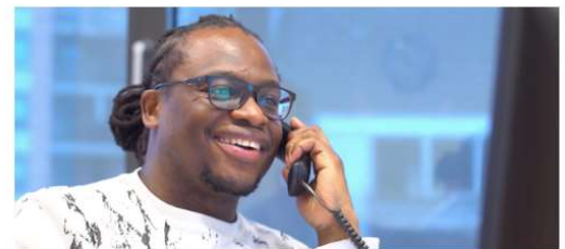
Gegevens delen met partners

Je kijkt mee hoe je om kan gaan met vragen over het delen van informatie met partners. Hoe zorg je dat je binnen de regels blijft en je ondertussen ook de relatie met de ander verstevigt.