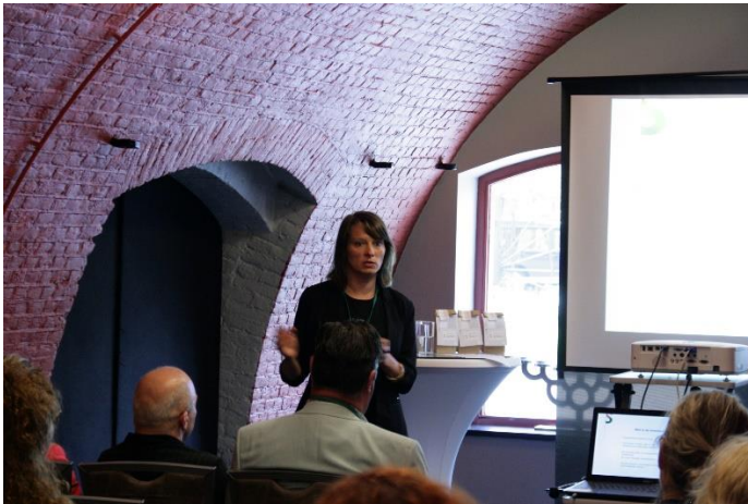
Kwaliteitslabel Sociaal Werk