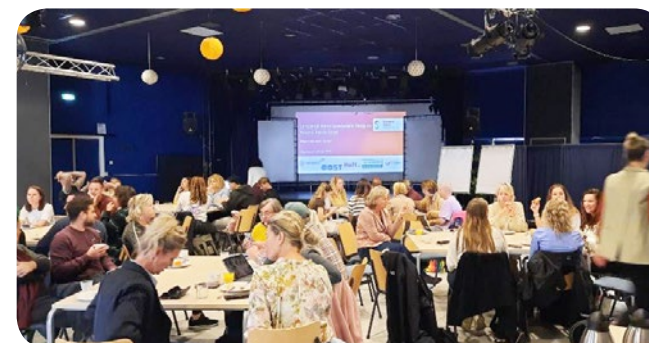
Landelijk Kennisnetwerk bijeenkomst – Groningen