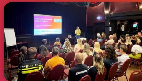
Uitwisselen doet leren en ontwikkelen