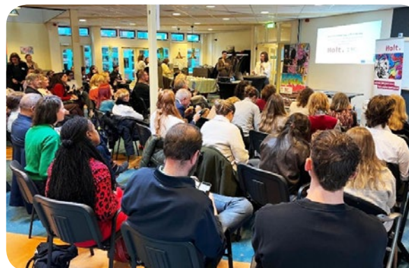
Bijeenkomst ‘Buiten het strafrecht, binnen de samenleving’ – Den Haag

Op 20 november 2025 organiseerden Halt en Sociaal Werk Nederland met partners uit Ierland en Griekenland een conferentie in Den Haag. En we verkenden samen hoe we kunnen komen tot een meer gevarieerd en flexibeler aanbod van buitenstrafrechtelijke afdoeningen, zoals de politie reprimande en de Halt afdoening in samenwerking met jongerenwerk. De bijeenkomst heeft geleid tot concrete ideeën en pilots voor een zo effectief en efficiënt mogelijke maatschappelijke inbedding van het jeugdstrafrecht in Nederland. We zijn voornemens om deze ideeën op 19 november 2026 breder te delen via een debat in aanwezigheid van Kamerleden.