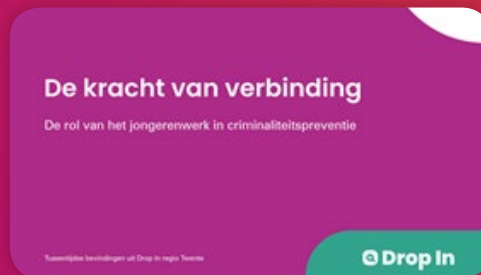
Jongerenwerk heeft een cruciale rol in criminaliteitspreventie

Drop In (2023-2026) streeft ernaar om via praktijkgericht onderzoek en uitwisseling de rol van het jongerenwerk in criminaliteitspreventie te verduidelijken en te versterken. In deze jaarupdate van het tweede projectjaar bundelen wij de gezamenlijke opbrengsten.