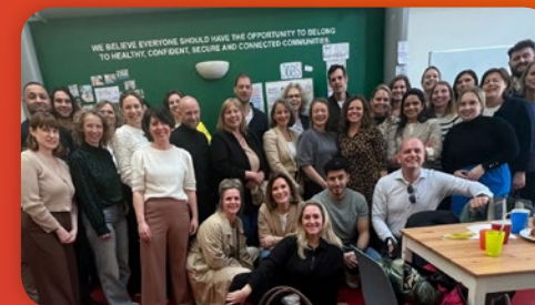
Leren over de grens: Diversion in Ierland