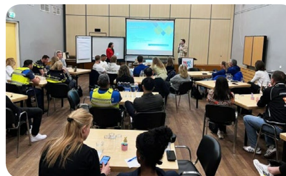
Regionale bijeenkomst Drop In – Beverwijk, Noord-Holland