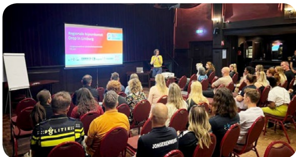
Regionale bijeenkomst Drop In – Landgraaf, Limburg