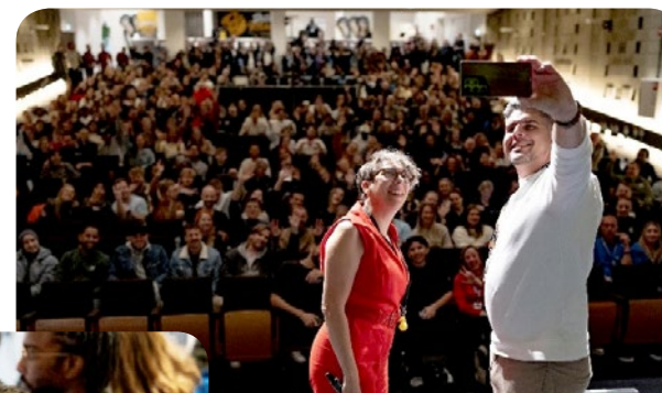
Landelijke dag Kinder- en Jongerenwerk – Rotterdam