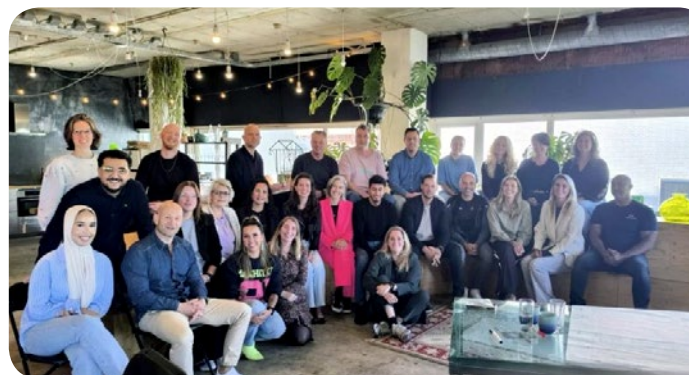
Landelijke projectgroep Drop In