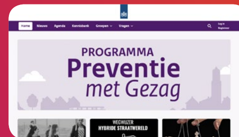
Achtergrond en onderbouwing