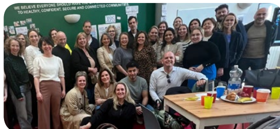
Groepsfoto studiereis Dublin – april 2025

Later het jaar concludeerde de Raad voor Strafrechttoepassing en Jeugdbescherming (RSJ) in ‘Een nieuw perspectief op buitenstrafrechtelijke afdoeningen voor jeugdigen’ (2025) dat er behoefte is aan een herzien en uitgebreider stelsel van buitenstrafrechtelijke afdoeningen. Afdoeningen buiten het strafrecht blijken immers bijna 20% effectiever dan interventies daarbinnen.