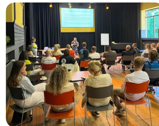
Regionale bijeenkomst Drop In – Haaksbergen, Twente