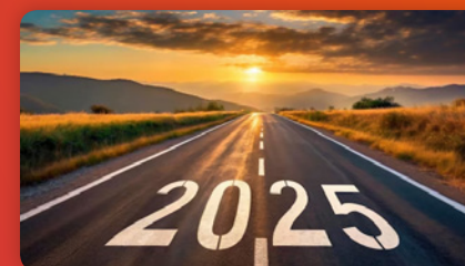
Vooruitblik naar 2025