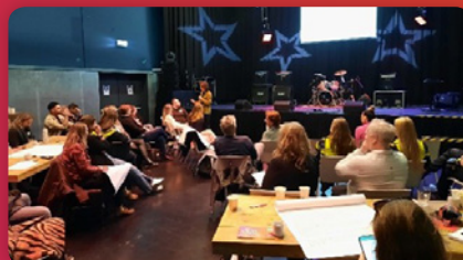
Kick Off van het praktijkgerichte onderzoek in regio's