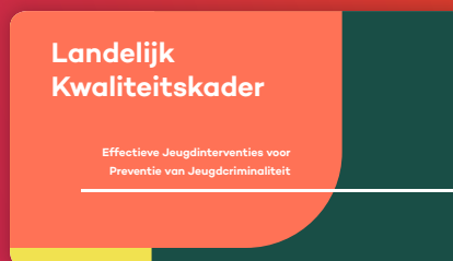
Achtergrond en onderbouwing