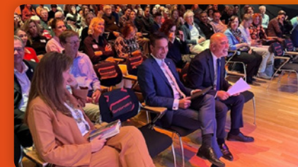
Bestuurlijk Congres Kinder- en Jongerenwerk op 17 oktober