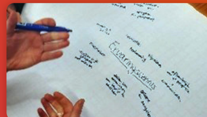
Landelijk Kennisnetwerk reizend van Utrecht tot aan Bergen op Zoom