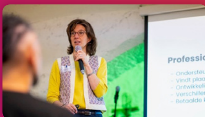
Lerend Netwerk Specialistisch Jeugdwerk