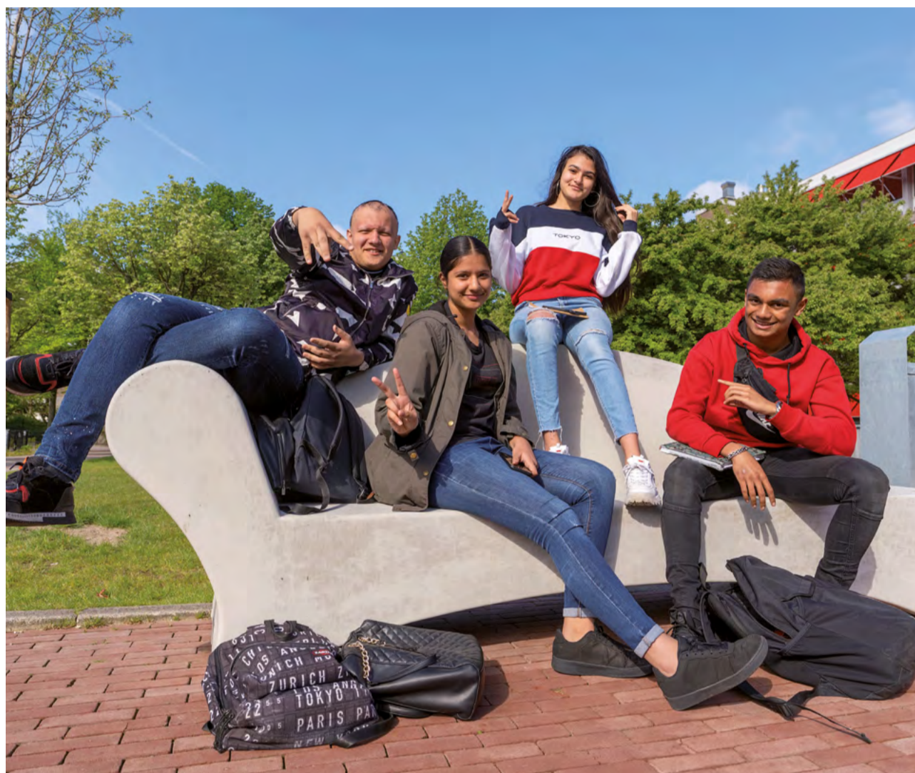
Leerlingen van het Rijswijkse College leren in workshops hoe ze het beste met geld om kunnen gaan.